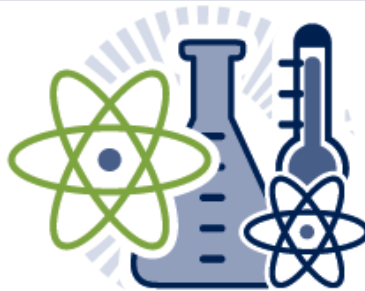
2. Centro de innovación tecnológica