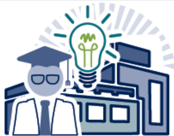
1. Centro de investigación