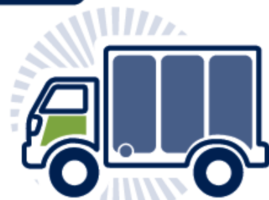
3. Desarrollo de proveedores