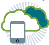
4. Break through tecnológico, avance significativo