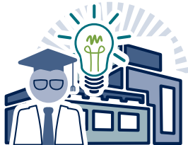
1. Centro de investigación