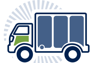
3. Desarrollo de proveedores